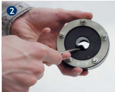
2 Lamelle mit der Hand/Schraubenzieher....