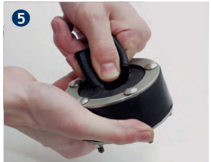
5 ...und Lamellen abziehen.

Die Montage der vorbereiteten Dichtung gemäss der Montageanleitung Pressringdichtung.