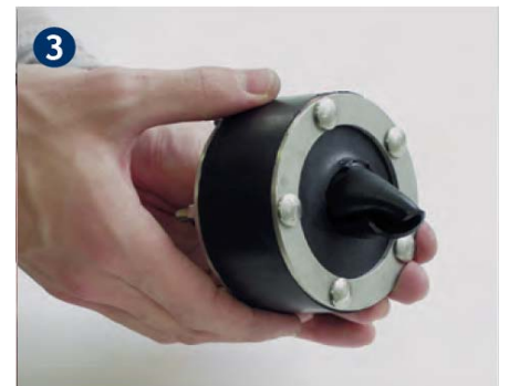
3 ....nach hinten durchdrücken.