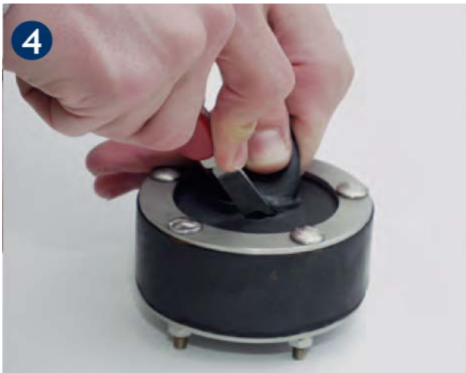
4 Resthaut leicht einschneiden....